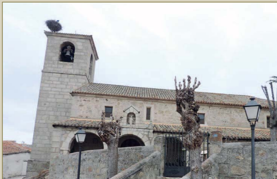
Iglesia de San Nicolás de Bari en Lozoyuela

vistos en esta sección, de unos tiempos remotos en los que, aun siendo nuestra comarca bien diferente paisajísticamente hablando a la que podemos contemplar ahora, sigue manteniendo, como en esos remotos siglos, su espíritu agreste propiciada por una oro-