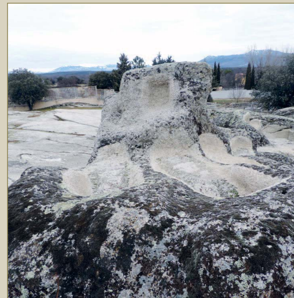
De entre todas ellas destaca el conjunto denominado Tumba de los Reyes, formado por un par de sepulturas, separadas del resto, con un pequeño nicho para supuestamente guardar ofrendas

Las tumbas, tras las excavaciones arqueológicas realizadas desde el año 2001, han sido perfectamente conservadas para propiciar un encuentro con la historia sin dañar en absoluto la necrópolis, cuya valla delimitadora arranca de los mismos muros de la iglesia de San Pedro Apóstol, levantada en el siglo XVII y que a buen seguro se asienta sobre más tumbas medievales.