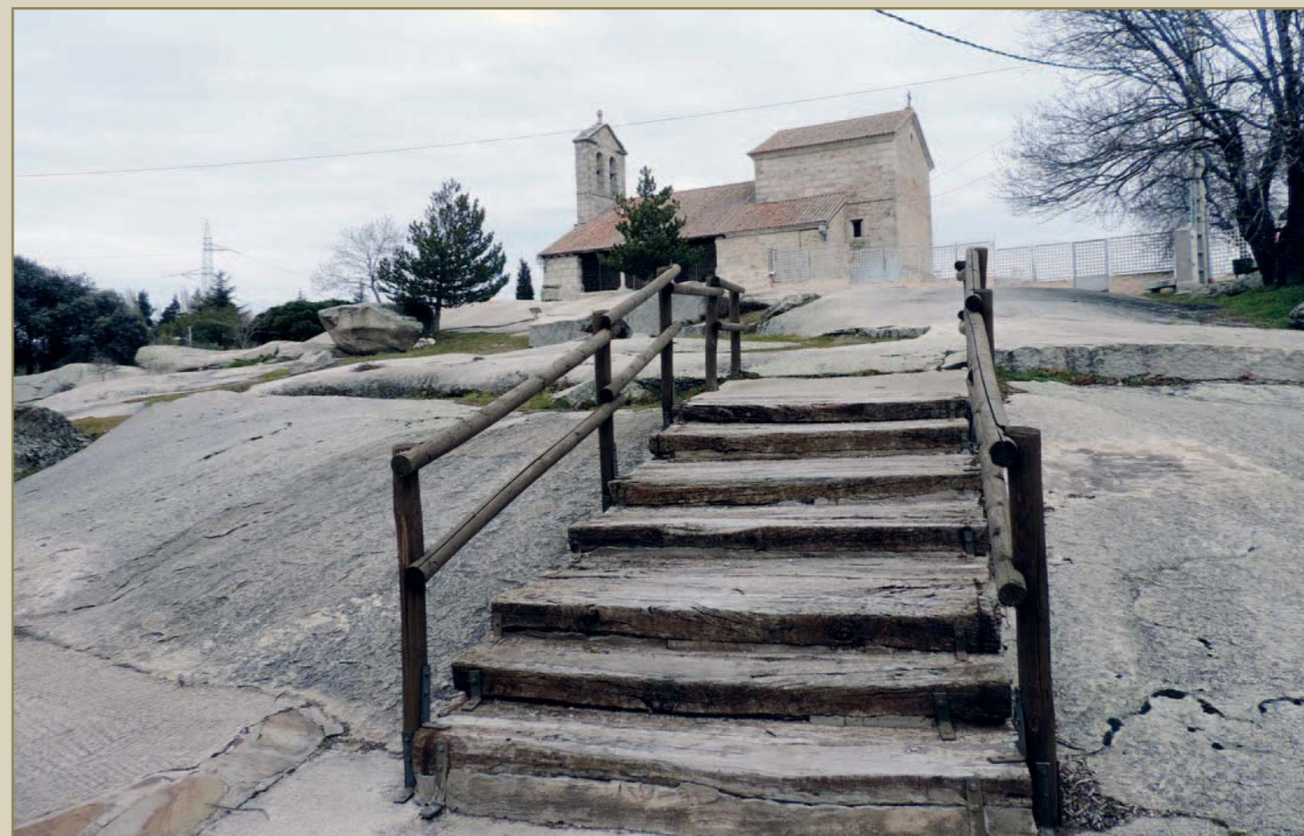
La necrópolis con la iglesia de San Pedro Apóstol al fondo

A brimos ahora una nueva página de la historia de la Sierra de Guadarrama en esta Guía arqueológica serrana. De