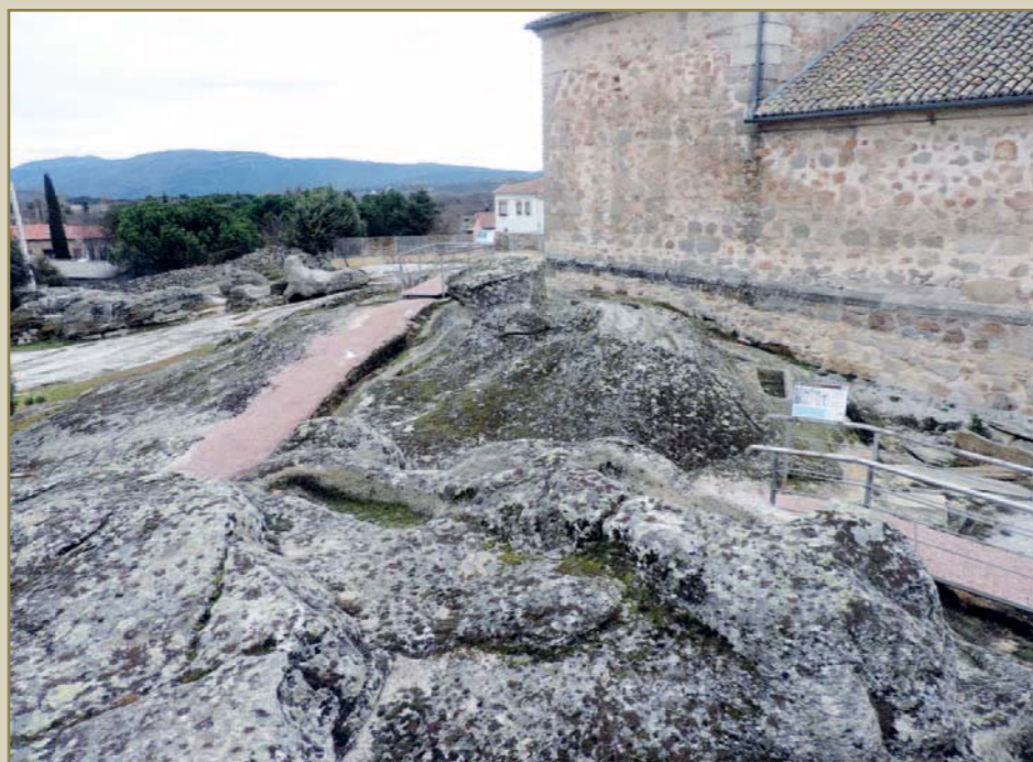
Las tumbas, cuya valla delimitadora arranca de los mismos muros de la iglesia de San Pedro Apóstol, levantada en el siglo XVII y que a buen seguro se asienta sobre más tumbas medievales

De esta forma dejamos escrita una nueva página en la que reco-