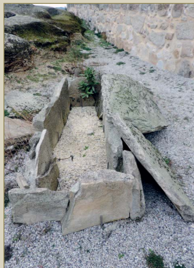
Tumba de la necrópolis tipo cista