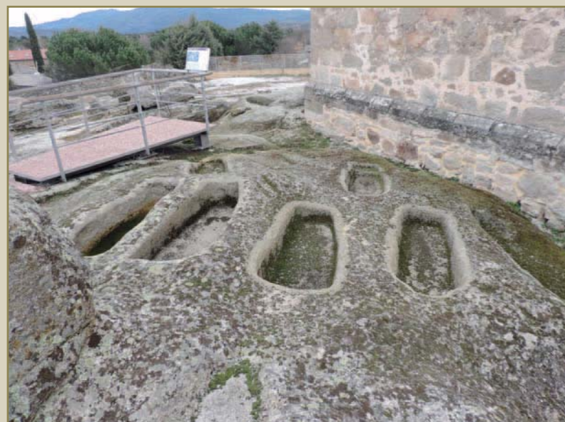
Tumbas excavadas en la piedra pertenecientes a la tipología de bañera

Las tumbas halladas en Sieteiglesias, 85 en total descubiertas hasta la fecha, son tanto del tipo denominado “bañera”, como antropomorfas, existiendo algunas sepulturas formadas por lajas (algo que ya vimos en La Cabrera) y otros enterramientos que combinan características de ambos grupos. Las tumbas estudiadas por los arqueólogos se reparten entre dos zonas separadas por una vaguada natural por la que discurre un camino vecinal de Sieteiglesias, estando muy cerca la una