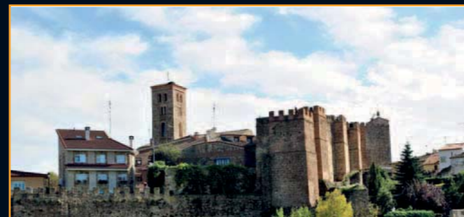
Una de las entradas al recinto amurallado

Llegamos así al final de esta nueva ruta por la historia de