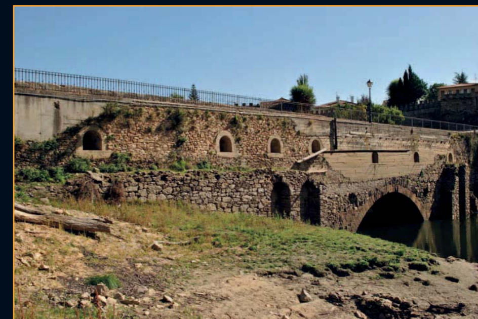
Puente Viejo o Puente del Arrabal

Apenas dejemos atrás la penumbra del interior de la puerta principal nos damos de bruces con coqueta iglesia de Santa María del Castillo, que fue duramente casti-