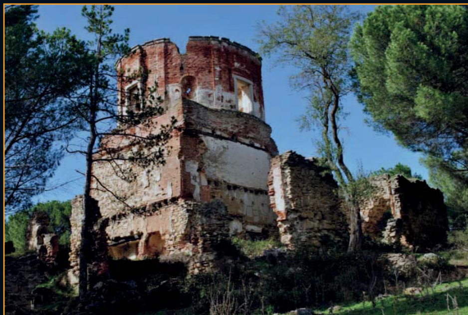
Torre que preside el conjunto de la Casa del Bosque

fortificado como no hay otro en nuestra comunidad autónoma; una iglesia junto a la cual se descubrió una necrópolis; un castillo en el que vivió Juana La Beltraneja y las ruinas de un palacio de recreo renacentista al otro lado del río Lozoya.