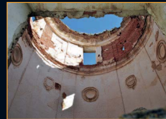
Interior de la torre

herradura; una tiene la firma cristiana y la otra musulmana.