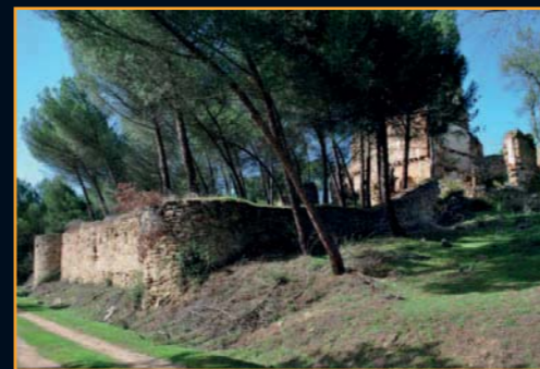
Su conjunto está rodeado por una suerte de muralla de la que se conservan en bastante buen estado dos pequeñas torres

Tras desandar el camino que nos ha conducido hasta la Casa del Bosque nos detendremos un momento ante el Puente Viejo o Puente del Arrabal, otro de los monumentos menos conocidos de Buitrago del Lozoya. Este puente, construido a finales del siglo XIV sobre el río Lozoya, comunicaba el pueblo amurallado con el barrio extramuros de Andarrío. En su cara septentrional, se pueden observar unos contra-