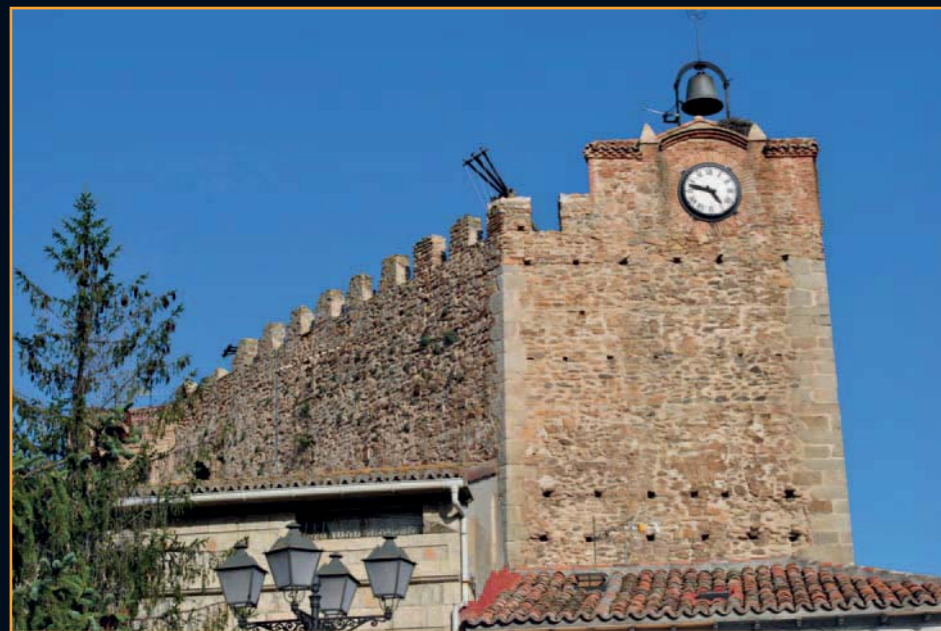
La Torre del Reloj, una torre albarrana de 16 metros de altura y planta pentagonal

yacimiento está fuera de nuestra mirada puesto que fue cubierto una vez terminada la exploración arqueológica de los testimonios históricos.