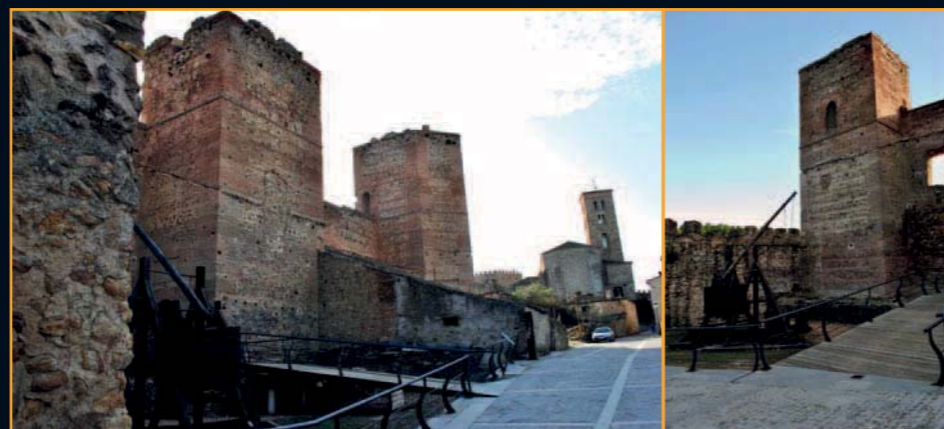
Un paseo por las almenas de este recinto amurallado es la mejor manera posible de descubrir este tesoro tan bien conservado de la Sierra de Guadarrama

Dirigimos ahora nuestros pasos hacia el río Lozoya, cuesta abajo. Allí nos encontramos con el castillo de Buitrago, la última parada del viaje que proponemos este mes al lector de Apuntes de la Sierra . Es de estilo gótico-mu-