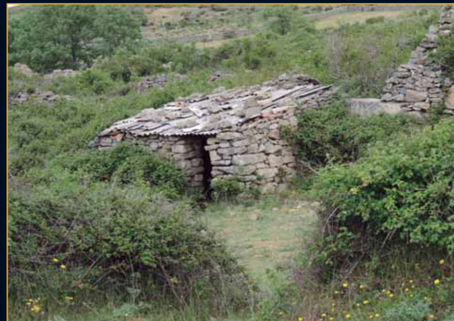
Las zarzas y las especies leñosas de alta montaña siguen sin pausa el trabajo que vienen haciendo durante años

Casi desde que damos el primer paso por el camino rural que nos llevará directamente a las ruinas de La Lastra, podemos vislumbrar la espadaña de la antigua iglesia de este despoblado. Aunque no se trata más que de una de las cuatro paredes que dieron forma al complejo religioso, lo que rezuman estos restos, así como los otros que rodean el templo, nos transmiten una suerte de melancolía por lo que fue un lugar que albergó esperanzas, sueños y, en definitiva, vida. Todo eso se acabó