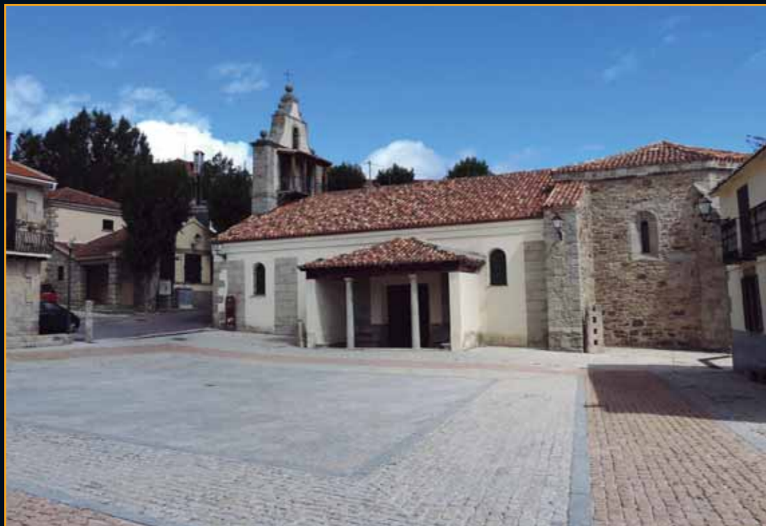
Santa María de la Alameda

En este sentido, quizá, aunque esto sólo es una hipótesis, entre los vecinos de La Lastra no sólo hubiera ganaderos, pudiendo existir herreros o esquiladores, por ejemplo, es decir, personas que practicarían oficios que pudieran dar servicio a los pastores trashumantes que pasaban año tras año por delante de sus humildes casas levantadas con el oscuro granito típico de esta comarca.