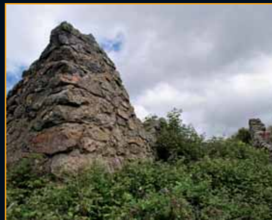
Por desgracia, sendos incendios en Peguerinos y Santa María de la Alameda han hecho que no quede apenas nada del devenir de la vida de La Lastra. Lo que sí parece claro es que el origen de este pueblo de alta montaña vino dado por el paso de la Cañada Real Leonesa

definitivamente con el estallido de la Guerra Civil, un trágico suceso histórico que marcó profundamente muchos rincones de nuestra Sierra de Guadarrama. En el caso que nos ocupa de La Lastra, los azares de la vida colocaron al pueblo en plena línea de combate, siendo bombardeado sin piedad su caserío. Los habitantes de La Lastra tuvieron que abandonar forzosamente sus casas, no volviendo ya nunca a habitar entre aquellas paredes. Unas gentes pobres que dejaron atrás los techos que a muchos, a buen seguro, les vieron nacer. Hoy algo de