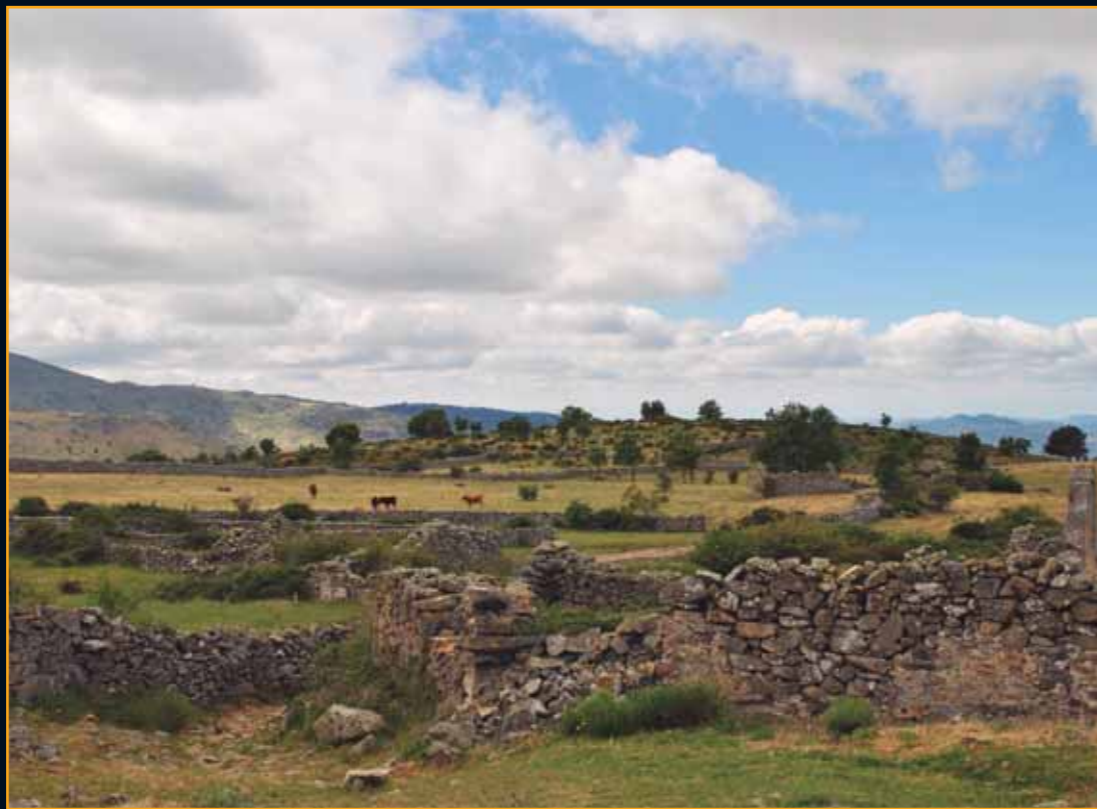
Las paredes a medio caer de las casas que formaron el pequeño poblado son hoy el único recuerdo de un lugar con un entorno natural privilegiado

Estas dos leyendas, que como antes decíamos son parte de la ri-