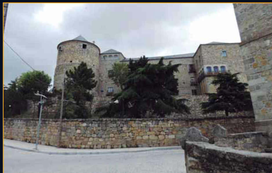
Como complemento a nuestra salida de este mes es muy recomendable la visita del cercano pueblo de Navas del Marqués, destacando su castillo